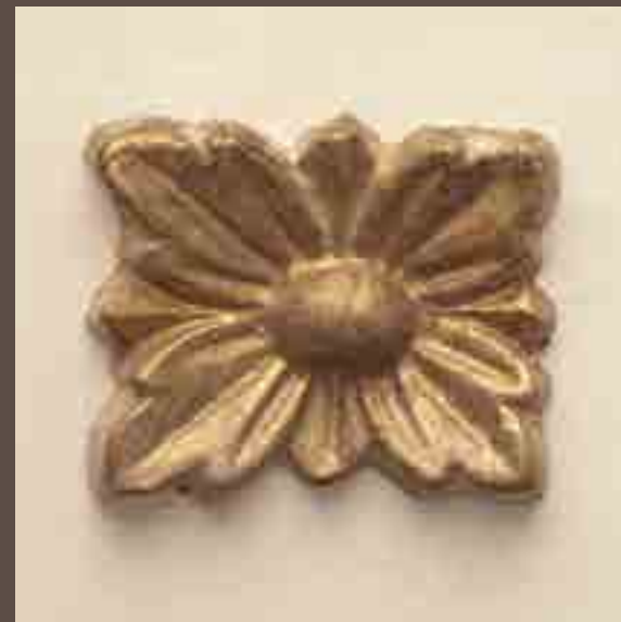
Cod 006_Bianco gessato oro