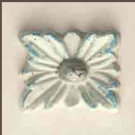
Cod 007_Carta da zucchero e argento