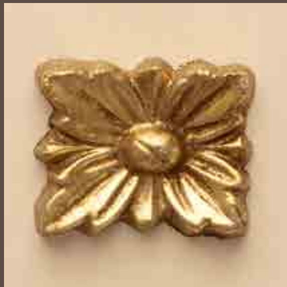
Cod 004_Cipria e oro