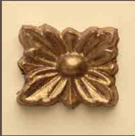
Cod 001_Avorio e oro patinato