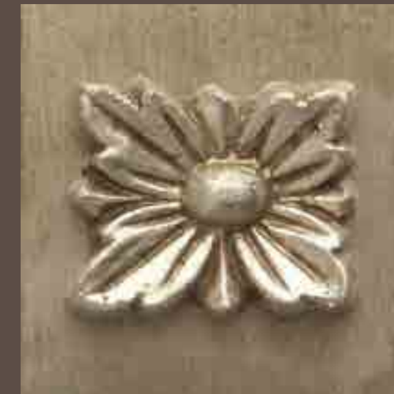
Cod 014_Argento anticato