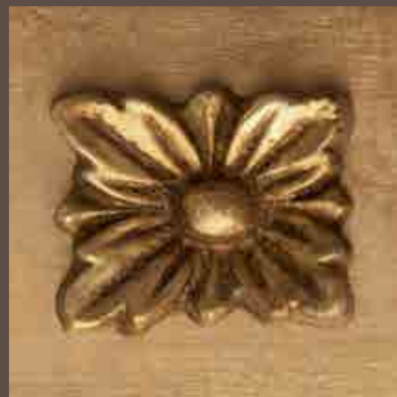
Cod 008_Oro anticato