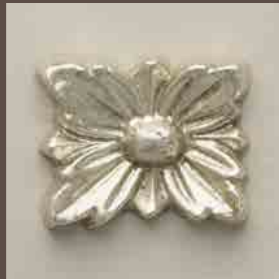
Cod 005_Cenere e argento