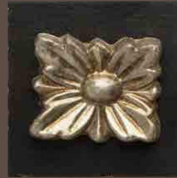
Cod 010_Nero antigua e argento