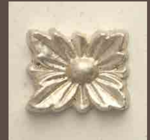
Cod 015_Bianco e argento 900