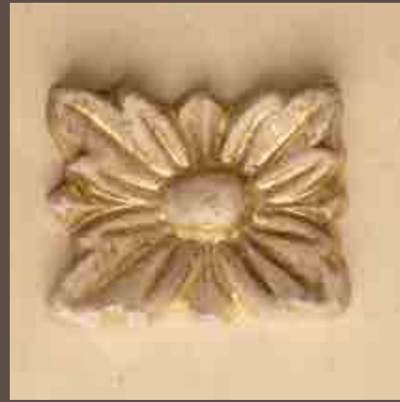
Cod 003_Ecru e oro sbiancato