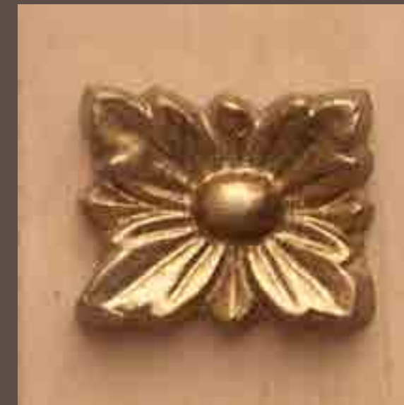
Cod 013_Quercia e oro