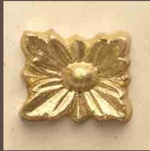
Cod 002_Spatolato e oro