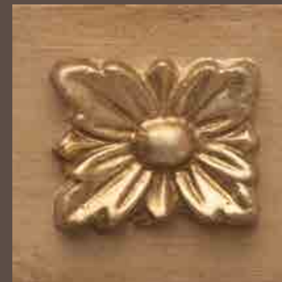
Cod 016_Castegua e oro