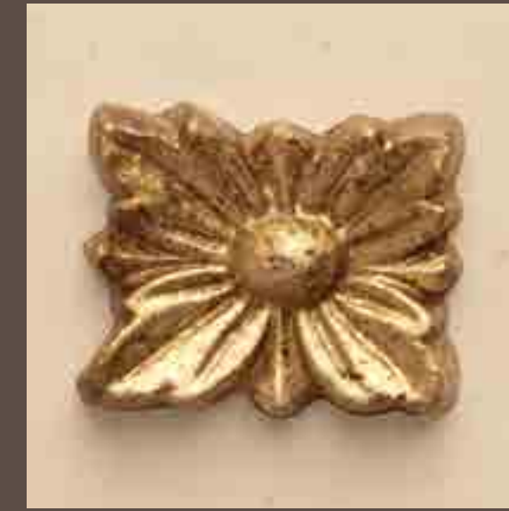
Cod 011_Bag e oro