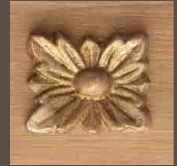
Cod 012_Decape oro sbiancato