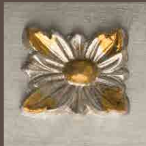
Cod 009_Armento mecca